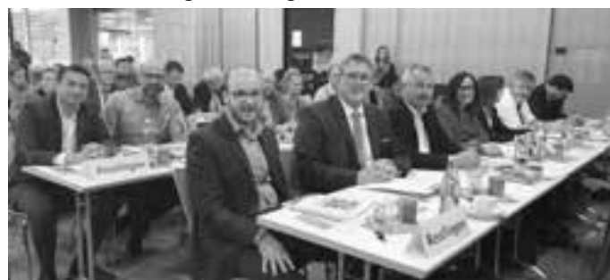
Die Reutlinger Delegierten in Salem